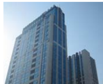
三菱电机自动化中心 Mitsubishi Electric Automation Center

FA Centers provide effective and reliable support to you with our service shop network. Please contact your nearest FA center.